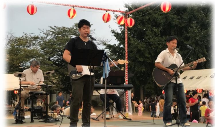
ドラムとギターは当院副院長です！