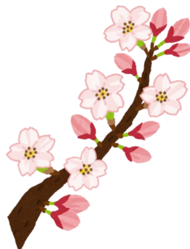
くわみず病院外来医師体制表(2018年4月)

～診療時間～ 午前 9:00～12:00 午後 14:00～17:00 夜間 17:00～19:00 (休診)木曜午後・土曜午後・日祝日